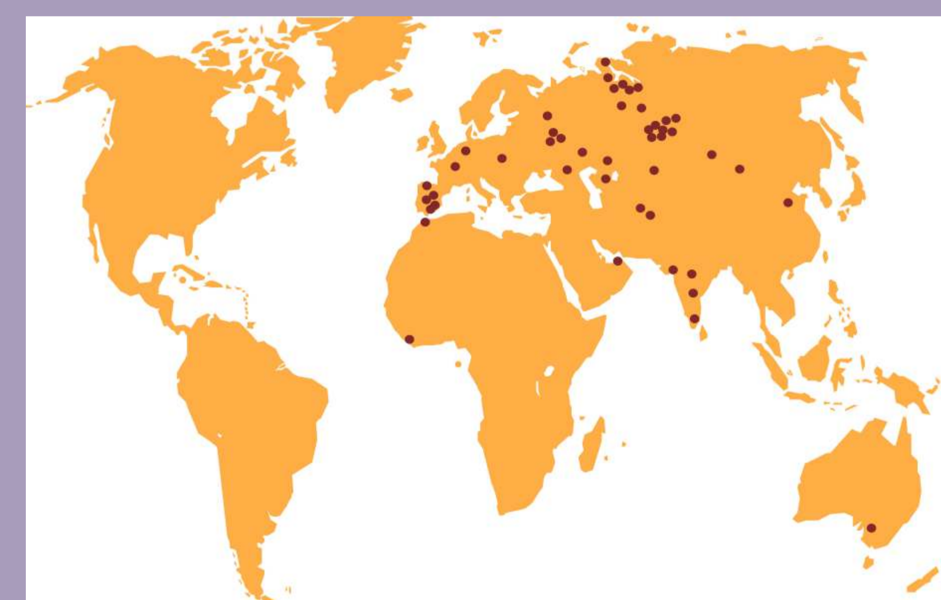
Карта мест, где выполнены ЯМР зондирования с помощью прибора «Гидроскоп»

Общая масса прибора (вместе с кабелем антенны и питающими аккумуляторами) около 400 кг.